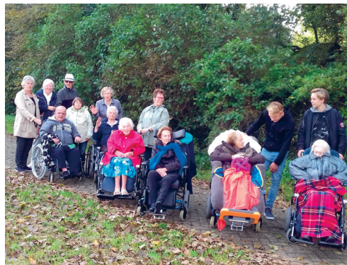
WANDELEN MET BEWONERS