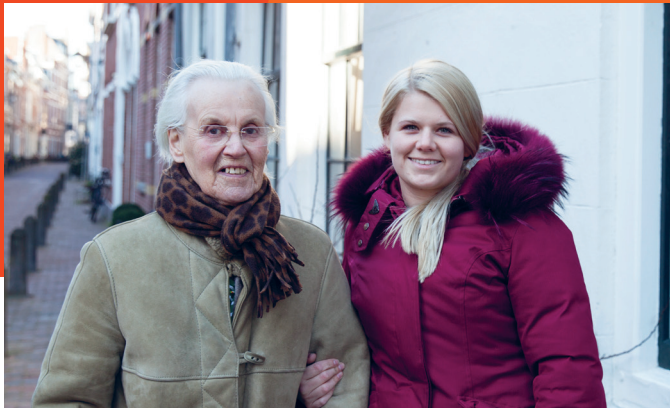
WIJ ZIJN MAATJES!

Op 1 januari 2018 gingen Amie Ouderenzorg en SHDH samen verder onder de naam Kennemerhart