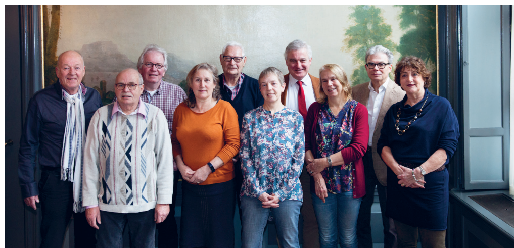
De centrale cliëntenraad van Kennemerhart

Kennemerhart heeft in deze regio tien woonzorgcentra die bijna allemaal een lokale cliëntenraad hebben en een cliëntenraad voor thuiswonende cliënten. Zij vormen de stem van de mensen