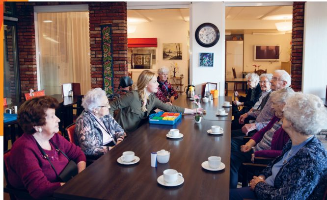
IEDERE AVOND EEN INLOOPHUISKAMER