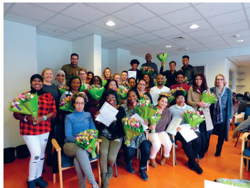
CERTIFICAAT 'LEREN IN DE ZORG' VOOR ANDERSTALIGEN EN STATUSHOUDERS