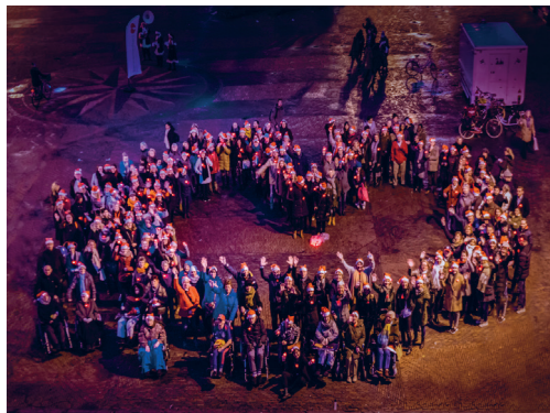
DE NIEUWE NAAM IS BEKEND! EEN (KENNEMER)HART OP DE GROTE MARKT

Kennemerhart is mede dankzij haar vrijwilligers wie ze is: een eigentijdse organisatie die voldoet aan de wensen en behoefte van de cliënt. Wij zijn daarom altijd op zoek naar vrijwilligers. Iets voor jou? Ga naar kennemerhart.nl/vrijwilligers voor meer informatie.