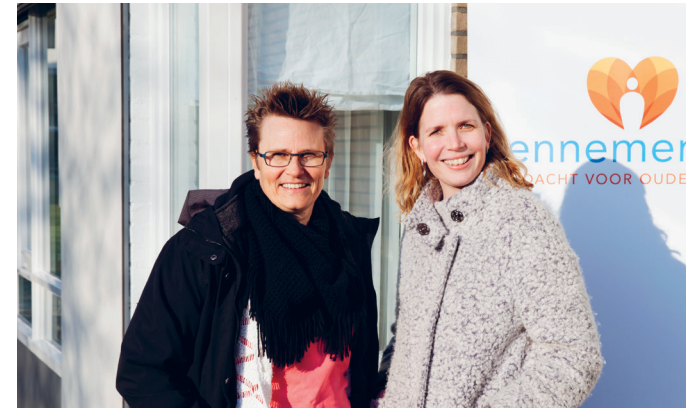
DE WEG NAAR THUISZORG

VOOR DE EERSTE BEWOONSTER VAN KENNEMERHART