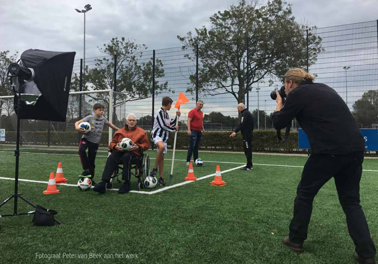
Fotograaf Peter van Beek aan het werk.

Het maakt ook dat ik me afvraag hoe we dit in de zorg die we verlenen een plaats kunnen geven. Dit vraagt om verdere reflectie en uitwerking. Sowieso is het zinvol om te blijven zoeken naar creatieve vormen die aansluiten bij de spirituele bronnen van de bewoner. Als geestelijk verzorger zie ik het ook als mijn taak om verpleeghuisbewoners een stem te geven. In dit project doen we dat door het exposeren van de foto's met de bijbehorende verhalen. Op de foto's zien we een medemens met zijn of haar unieke verhaal en passie. Ze roepen trouwens ook de vraag op hoe ikzelf in beeld gebracht zou willen worden: wat is mijn verhaal van levenskracht?