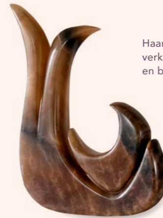
Haar beelden zijn verkocht in binnen- en buitenland.